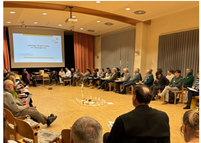
Das erste Seelsorgeteam-Treffen fand in Vorchdorf statt.

Als Pfarrgemeinderat wollen wir für unsere Pfarre und die Menschen in unserer Pfarre