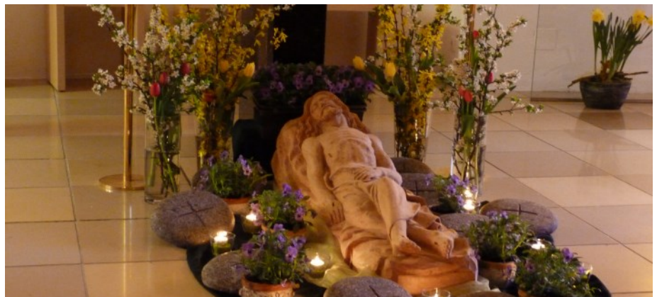
Am Karsamstag lädt das Hl. Grab in der Bertholdkapelle wieder ganztägig zu Gebet und Meditation ein.