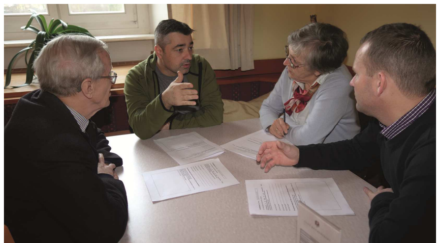
Diskussion während der Pfarrgemeinderats-Klausur

Kennenlernen genutzt, und sollte eine gute Tankstelle sein um mit neuer Motivation die neue Periode fortzusetzen.