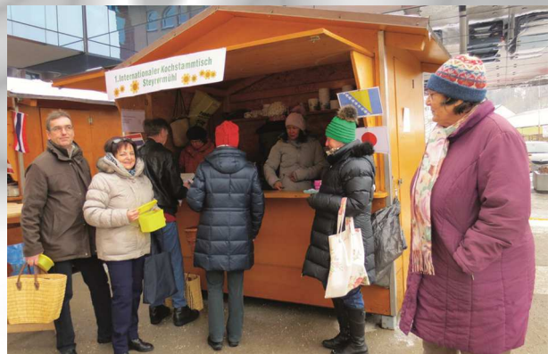
Beim Verkauf der Fastenspeisen

Der Internationale Kochstammtisch der Pfarre Steyermühl konnte durch den Verkauf von Fastenspeisen am Familienfasttag € 750,- an die Katholische Frauenbewegung für deren Projekte überweisen. Ein herzliches Dankeschön an alle die dazu beigetragen haben