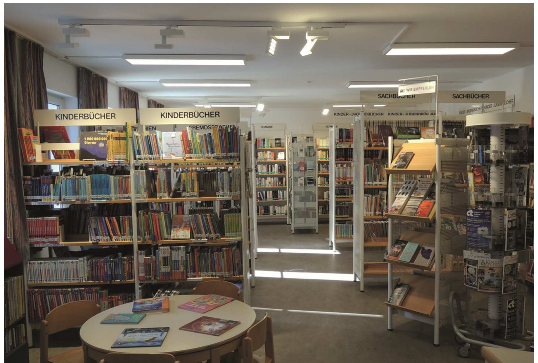
Die neu renovierte Bibliothek der Pfarre Laakirchen

Die Bibliothek hat derzeit 14 MitarbeiterInnen, die ehrenamtlich und unentgeltlich die kleinen und großen Nutzer betreuen. Zählt man die die Stunden, so stellen die BibliothekarInnen den Kunden jede Woche etwa 20 Stunden Entlehnzeit zur Verfügung. Im Jahr sind das mindestens 1000 Stunden.