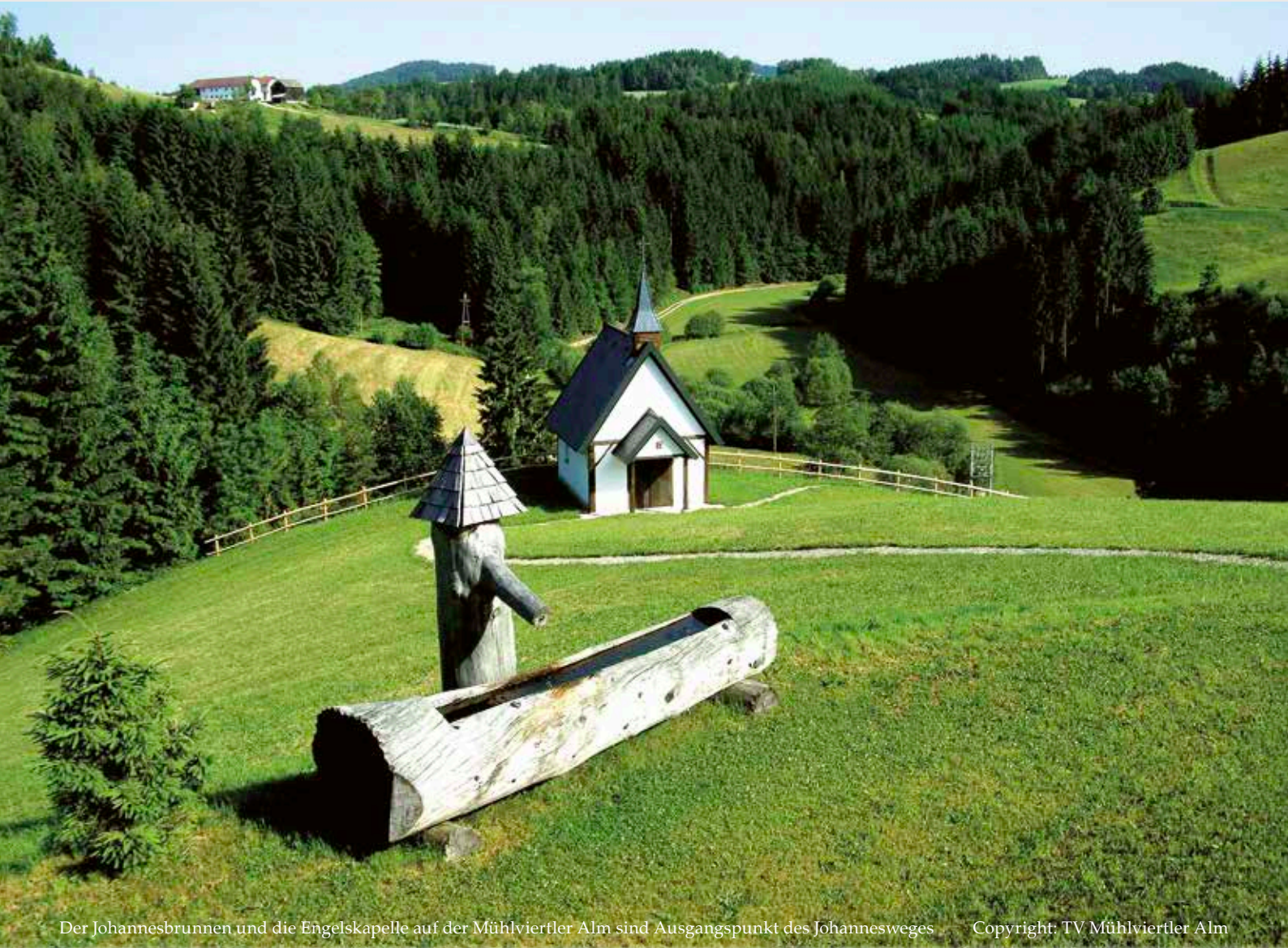
Der Johannesbrunnen und die Engelskapelle auf der Mühlviertler Alm sind Ausgangspunkt des Johannesweges

Erholsame Ferien wünschen Ihnen die Seelsorger und MitarbeiterInnen der Pfarre!