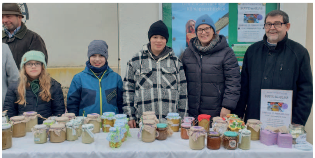
Fasttag Suppe im Glas

lien zu ernähren. Es gibt kein Mittel gegen die Klimakrise. Doch es gibt ein Mittel, sie besser zu bewältigen. Die kbf Partnerorganisation „Social Work Institute“ unterstützt Frauen mit Workshops, in denen sie lernen, Pflanzen widerstandsfähiger zu machen. Sie zeigen ihnen, wie sie mit alten Kulturtechniken wie z.B. Mulchen, das Wasser besser im Boden speichern können. Durch gemeinsame Investitionen werden ihre Erträge vergrößert und es kann ein eigenes Einkommen erwirtschaftet werden. Frauen im globalen Süden leiden am meisten unter der Klimakrise, obwohl sie diese am wenigsten verursacht haben.