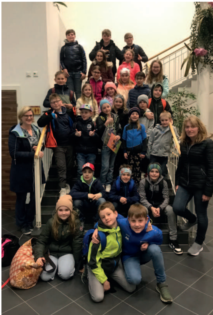
Ministranten-Ausflug ins Aquapulco