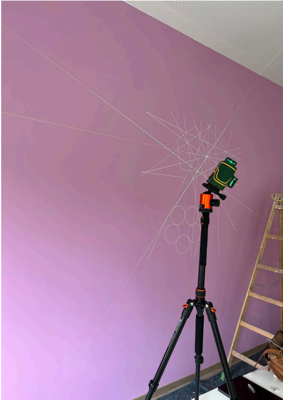
sub rosa, Umsetzung: Daniel Zauner, Vöcklabruck