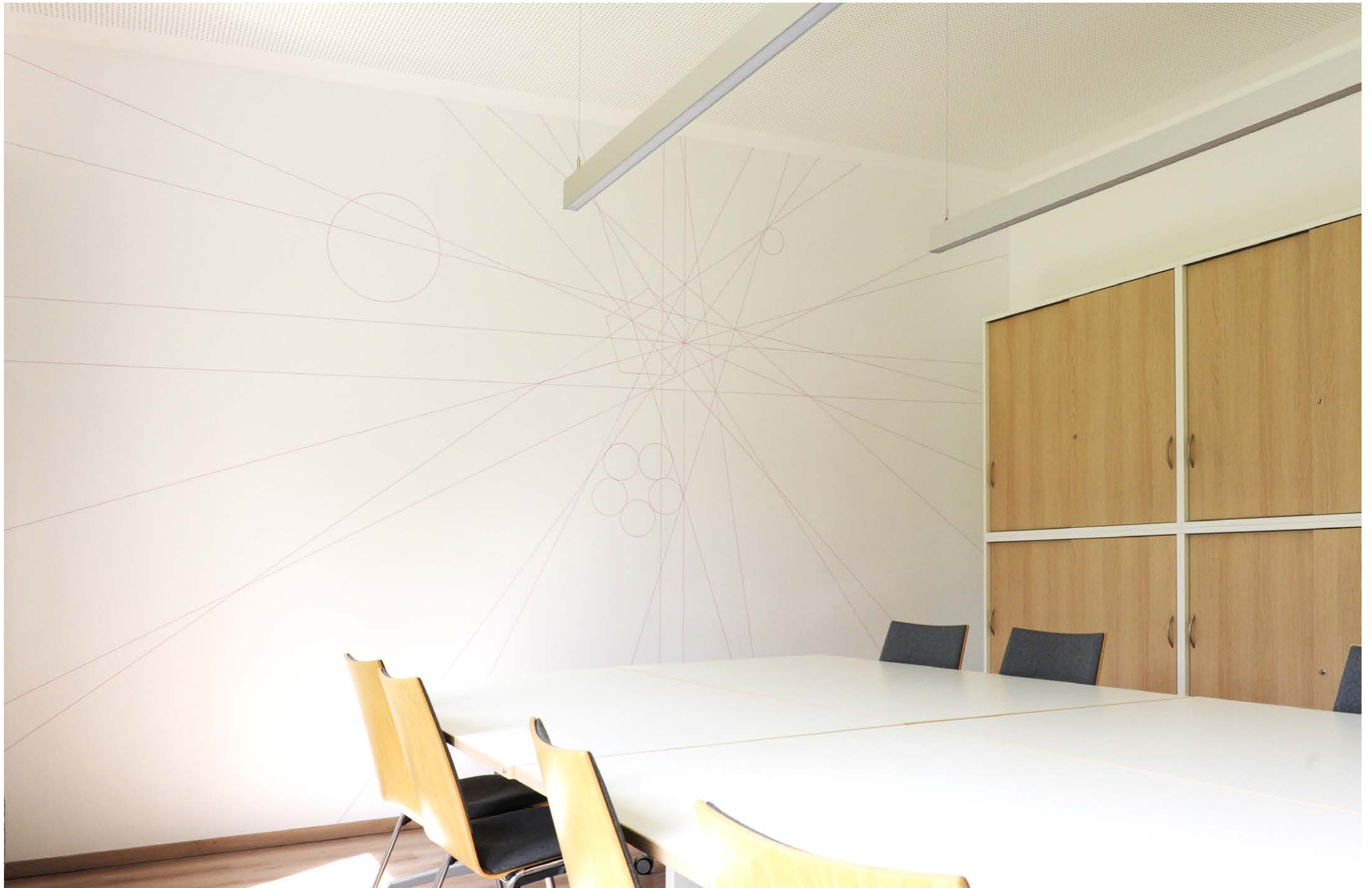
sub rosa , Annelies Senfter, 2022, 313,5 x 500,5 cm und 23,5 x 23,5 cm Wandmalerei, Sitzungszimmer im Pfarr- und Gemeindezentrum Amaliahaus