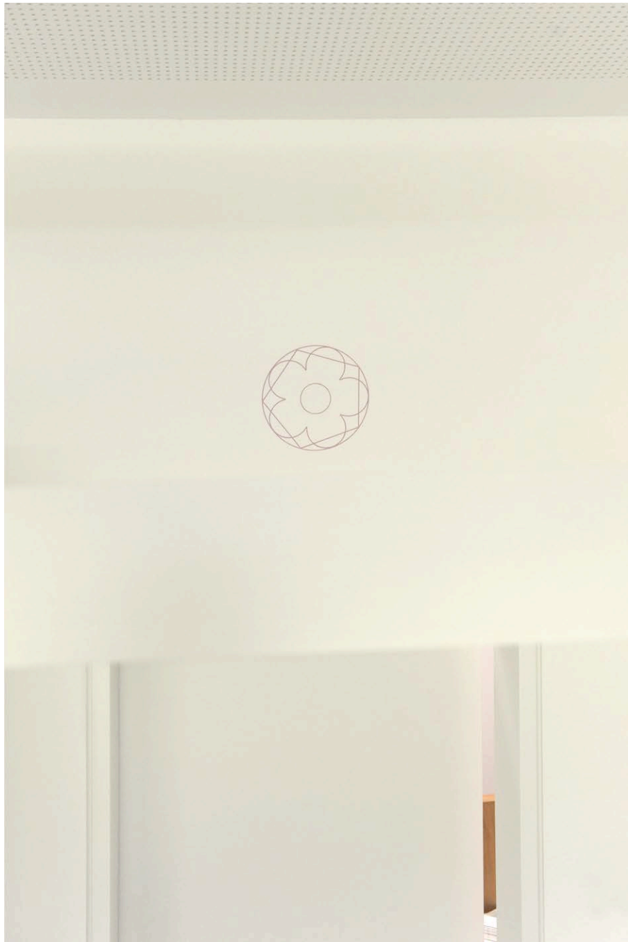
sub rosa, Annelies Senfter, 2022, 313,5 x 500,5 cm und 23,5 x 23,5 cm Wandmalerei, Sitzungszimmer im Pfarr- und Gemeindezentrum Amaliahaus

Die auffälligste Eigenheit der römischen Wandmalerei ist die allgemeine Verbreitung künstlerisch oft sehr anspruchsvoller Dekoration in allen Bereichen des Lebens. Nicht nur Tempel oder öffentliche Gebäude, sondern der gesamte Wohnbereich, selbst kleinste Wohnräume oder Schlafzimmer waren ausgemalt. Dies ist ein Phänomen, das in der europäischen Kunstgeschichte keine Parallelen hat. Erstaunlich dabei ist der Detailreichtum und die Qualität vieler Malereien, auch in einfachen Zimmern oder in Gräbern. Dies gilt nicht nur für die Hauptstadt Rom selbst. Auch kleinere viillae rusticae , die man heute als mittlere Bauernhöfe bezeichnen würde, haben zumindest einen aufwändig ausgemalten Raum. Diese Vielfalt von Wanddekoration findet man in allen Provinzen des Römischen Reiches von Britannia bis Ägypten.