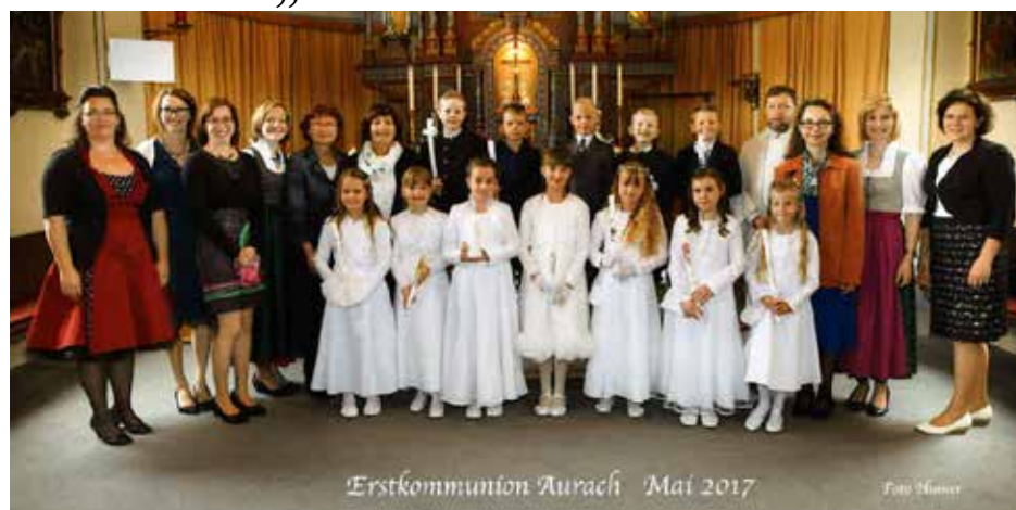
Erstkommunion Aurach Mai 2017