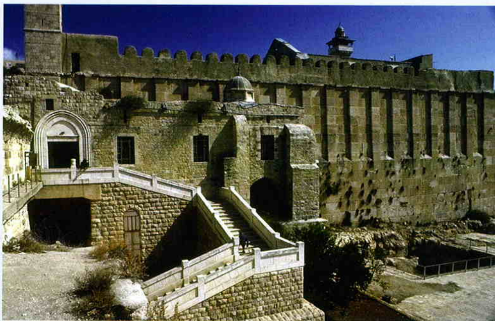
Położona w mieście Hebron grota Makpela jest czczona przez muzułmanów, chrześcijan i Żydów jako miejsce wiecznego spoczynku Abrahama . Budowlę o masywnych murach postawiono nad grobem na rozkaz Heroda Wielkiego.

nieważ również Dawid starał się o koronę, doszło do bitwy, w czasie której Abner zabił Asahela, brata Joaba (2 Sm 2,19-23). Po tym jak z powodu drugorzędnej żony Saula poróżnił się z królem Iszbaalem, prowadził potajemne pertraktacje z Dawidem (2 Sm 3,12n.17-21), został jednak zamordowany przez zwierzchnika wojsk Joaba w zemście za zabicie Asahela (2 Sm 3,22-30). Żałoba narodowa, którą ogłosił Dawid, świadczy o wielkim szacunku dla Abnera, a także subtelnym wyczuciu politycznym Dawida, bowiem zaskarbił sobie przez to przychyłość Królestwa Północnego (2 Sm 3,31-39). fr [msz]