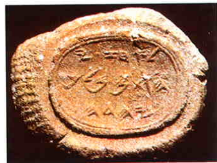
Pieczeń króla Achaza ; inskrypcja głosi: „Należy do Achaza [syna] Jotama, króla Judy” (wypalona glina, ok. 1 cm średnicy).

1) Rządził jako dwunasty król w Królestwie Południowym w latach 734-728 przed Chr. w okresie niezwykle napięć politycznych. Król Resin z Damaszku i Pekach, władca Królestwa Północnego, chcieli utworzyć przeciwko Asyrii koalicję obejmującą wszystkie światowe imperia. Ostrzeżony przez proroka Izajasza Achaz nie przyłączył się do tego sojuszu. Kiedy więc alians państw chciał przy pomocy środków militarnych zmusić małą Judę do przystąpienia do tzw. wojny syro-efraimskiej (734-732 r. przed Chr., nazwana tak ze względu na dwóch czołowych agresorów; zob. Iz 7,1-8), król – pomimo niezwykle gwałtownego sprzeciwu ze strony proroka Izajasza – zwrócił się o pomoc do Asyrii (2 Krl 16,5-9). Prośba ta spowodowała interwencję Tiglat-Pilesera III (745-727 r. przed Chr.). Błąd popełniony przez króla sprawił, że Izajasz polecił, aby całą nadzieję pokładać w tym momencie w mającym nadejść królewskim potomku. Teksty mówiące o tym (Iz 7,10-17; 8,23b-9,6; 11,1-8) są kamieniami milowymi w procesie rozwoju nadziei mesjańskiej (→Mesjasz). Obraz króla, na którym swe piętno odcisnął konflikt z prorokiem Izajaszem, został w późniejszym okresie poddany krytycznej ocenie: „popierał zepsucie w Judzie i bardzo sprze-