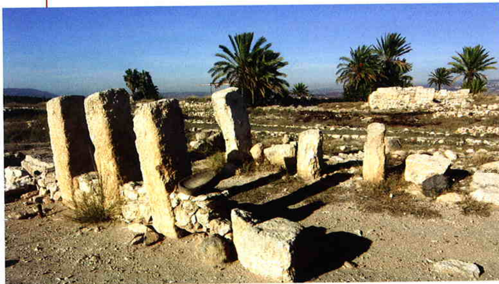
Król Achab , władca Izraela (Królestwo Północne) miał posiadać 2000 wozów bojowych; poza tym znany był ze swojej działalności budowlanej, czego przykładem może być Megiddo. Na zdjęciu: ruiny stajni w Megiddo.

bez mała sto lat „stan wojny” z Królestwem Judy. Te nowe relacje zostały przypieczone słubem córki (lub siostry) Achaba imieniem Atralia z judzkim następcą tronu Joramem (2 Krl 8,18). Potrafił zdobyć sobie uznanie także wśród ludów ościennych. Posłuszni mu byli Moabici (2 Krl 1,1). Wydaje się, że król Aramu Ben-Hadad dwukrotnie odważył się dokonać inwazji na terytorium Izraela. Wraz z 32 sprzymierzonymi oblegał Samarię (1 Krl 20,1-12), został jednak odparty (1 Krl 20,13-21). Kiedy podczas drugiej bitwy pod Afek został wzięty do niewoli, Achab zapowiedział, że daruje mu życie pod warunkiem, że tamten zwróci zajęte miasta i pozwoli na izraelski handel w Damaszku (1 Krl 20,34). Ze źródeł asyr. wiadomo, że Achab, zawarłszy sojusz z kilkoma innymi królami (np. tym z Damaszku), ruszył na wojnę przeciwko Salmanassarowi III i odparł Asyryjczyków (być może nawet zwyciężył pod Karkar – na podstawie danych archeologicznych rezultatu tej bitwy nie da