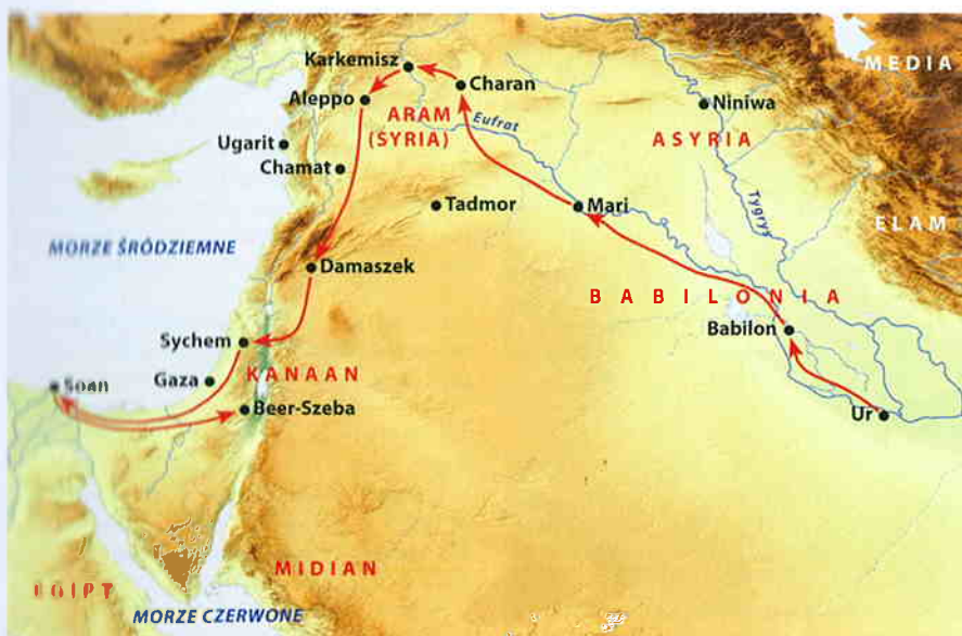
Wędrowki Abrahama wg Rdz 11,31–13,3.

protoplastą plemion południowosemickich. Miejscowościami, które odgrywają znaczącą rolę w opowiadaniu o Abrahamie, są Sy-