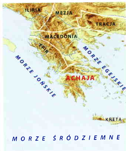
Rzym, prowincja Achaia.

2) Prorok żyjący w czasach Jeremiasza, który zamiast nadchodzącego wygnania zwiastował zbawienie; kara, która została mu za to obwieszona przez Boga, miała się stać przysłowiowa (Jr 29,22). fr [msz]