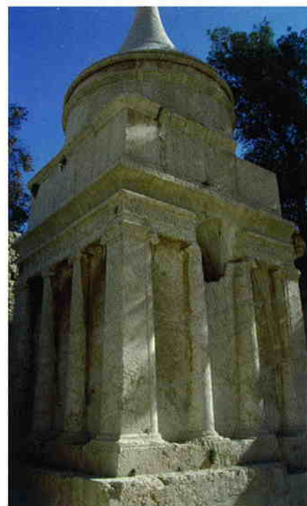
Od dawna tradycja żyd. podaje, że ten wykuty w skale grobowiec w dolinie Cedronu należał do syna Dawida Absaloma . Choć budowla pochodzi dopiero z I w. przed Chr., także dzisiaj określana jest mianem grobu Absaloma.

Chr. Od swego ojca przejął królestwo dobrze zorganizowane pod względem administracyjnym wraz z niedawno założoną stolicą Samarią (1 Krl 16,29-31). Skutki małżeństwa z tyryjską księżniczką → Izebel były wielorakie i doniosłe. Przyjaźń z Tyrem zagwarantowała mu dostęp do najważniejszych portów i szlaków handlowych. Za swych rządów zakończył również trwający