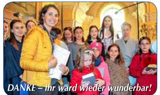
DANKE – ihr ward wieder wunderbar!