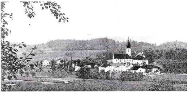
PRAMBACHKIRCHEN VOR DEM BAHNBAU 1909

Schmidbauer aus Waizenkirchen und der kräftigen Aktienerlösung der Gemeinde Prambachkirchen die „Absperrung vom Weltverkehre zu verhindern und für den Ort einen bequemen, sehr nahe gelegenen Personen- und Frachtenbahnhof zu erreichen“ (Pfarrchronik; Anm.: Die Waizenkirchner wollten nämlich anfangs auf keinen Fall einen Bahnhof in Prambachkirchen errichten. Lediglich in Unterbruck sollte eine Haltestelle sein). In der Bauzeit von nur 2 Jahren wurde trotz vieler Schwierigkeiten des