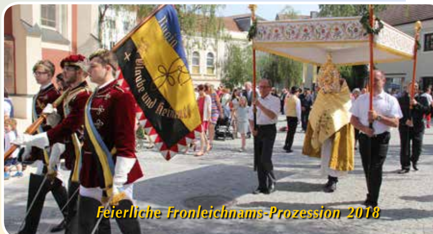
Feierliche Fronleichnams-Prozession 2018

FIRMSPENDER: Bischof EM. Maximilian Aichern OSB