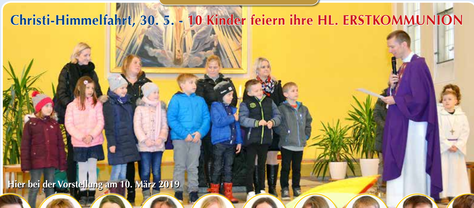
Hier bei der Vorstellung am 10. März 2019