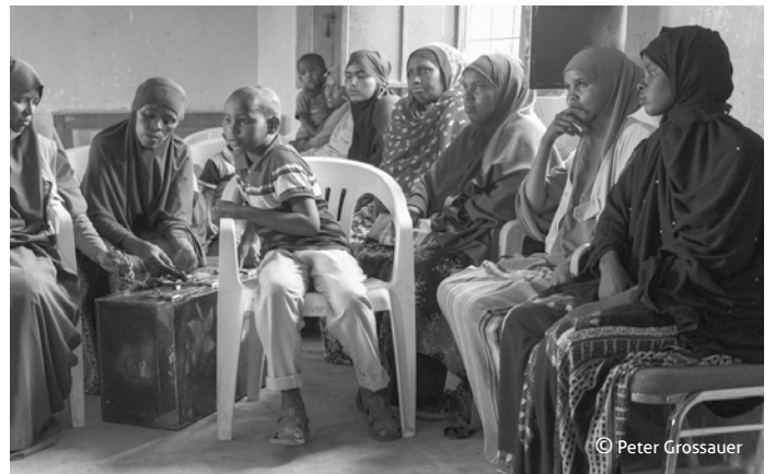
Foto: Frauengruppe mit Sparvereinskoffer