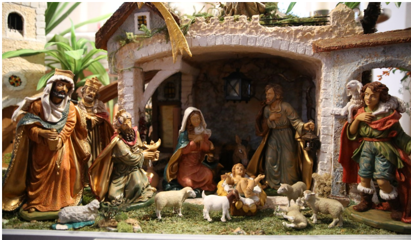
Krippe in der Pfarrkirche von Rainbach