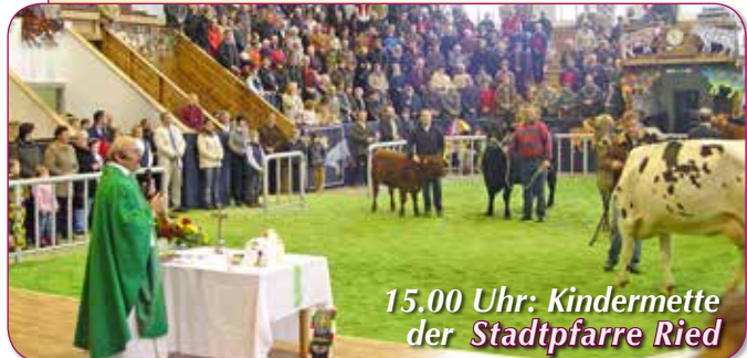
15.00 Uhr: Kindermette der Stadtpfarre Ried

Wir haben uns in den beiden Pfarren Stadtpfarre Ried und Pfarre Riedberg Gedanken gemacht, wie wir Weihnachten feiern können.