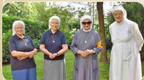
Lesen Sie auf Seite 3