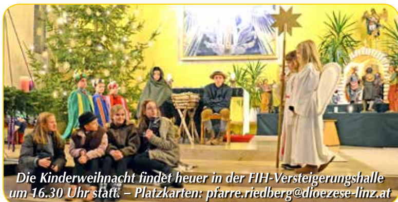
Die Kinderweihnacht findet heuer in der FIH-Versteigerungshalle um 16.30 Uhr statt. – Platzkarten: pfarre.riedberg@diözese-linz.at