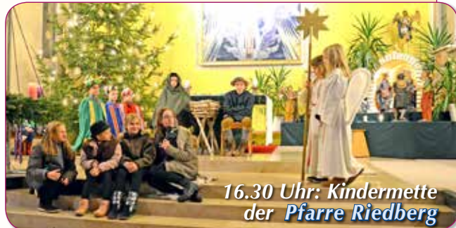
16.30 Uhr: Kindermette der Pfarre Riedberg

Wir haben uns in den beiden Pfarren Stadtpfarre Ried und Pfarre Riedberg Gedanken gemacht, wie wir Weihnachten feiern können.