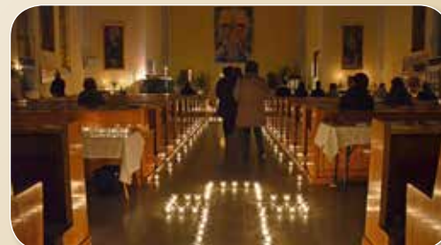
Lesen Sie auf Seite 11