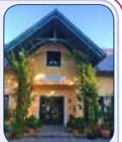
„Ein Haus voll Glorie schauet ...“ romantisches Pfarrheim Trumau Baden/Wien

Wir werden also unsere Stadtpfarr-Priester stets herzlich einladen, dass einer nach Möglichkeit seines Terminkalenders bereichernd vorbei schaut.