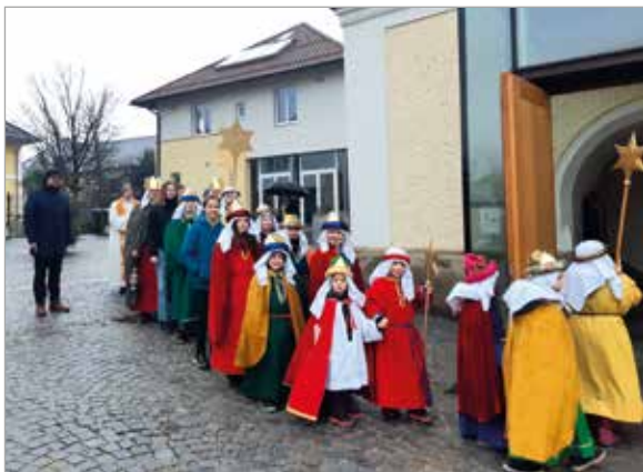
28./29./30.12.2023: Neben vielen kleinen und jugendlichen Sternsängern war auch eine Erwachsenen-Gruppe in unserem Pfarrgebiet unterwegs