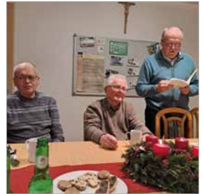
15.12.2023: Adventrunde der KMB