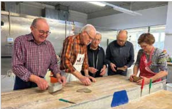
Feb.2024: Der Liebstattsonntag wirft bereits seine Schatten voraus. Viele fleißige Hände der kfb und KMB haben zusammengeworfen und rund 900 Herzen gebacken. Danke der Bäckerei Nöhammer für die Zurverfügungstellung der Backstube! Ein Teil der Herzen wurde beim ersten Verzierungstermin bereits beschriftet und verziert.