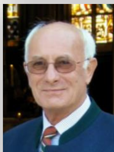
Humer Franz Wolfshütte 11 im 76. Lj.