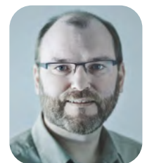
Peter Kollroß Selbständiger Fotograf, HTL-Lehrer für Fotografie