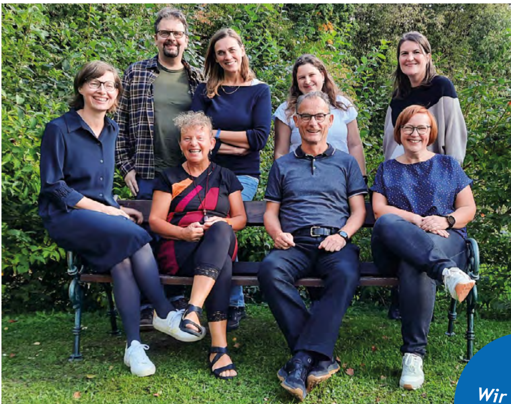
Team der Diözesanstelle KBW-Treffpunkt Bildung