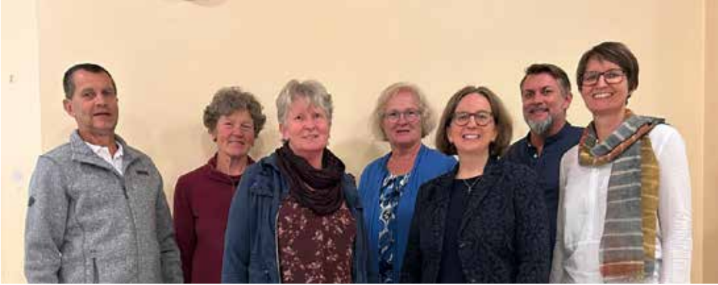
Die Mitglieder des Sozialbeirates der Pfarre von li nach re: