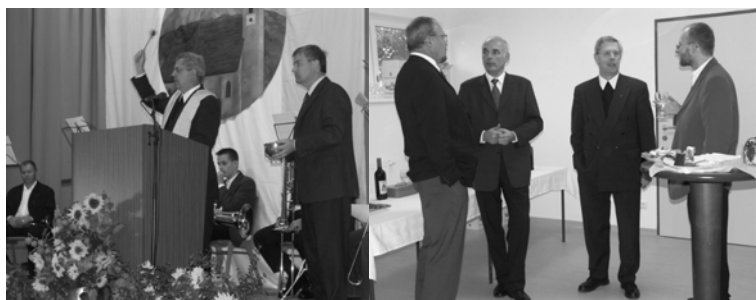
Ein Bilderbogen rund um das Eröffnungsfest des neuen Pfarrheimes.