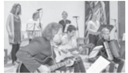
oben: Jugendband unten: Stadtkapelle Leoding

Herzlichen Dank an die Stadtkapelle Leoding, die die Erstkommunionfamilien auf dem Kirchenplatz musikalisch begrüßte.