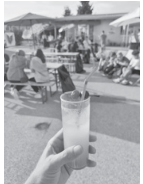
oben: „Barfuß-Bar“ beim Sommerfest; Fotos: Maria Arneith