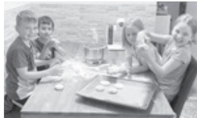
Fröhliches Brotbacken in der Erstkommunionsvorbereitung; Foto: Brigitte Rudinger

Zum Abschluss gab es für die Kinder vor der Kirche noch ein Frühstückssackerl