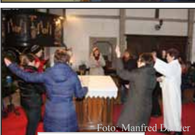
Fest: 60 Jahre -