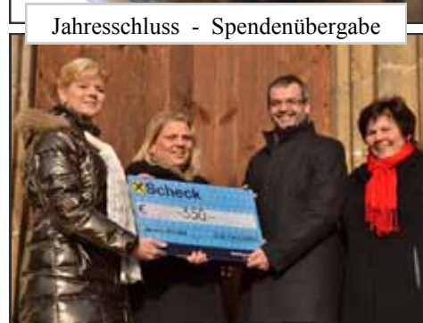
Jahresschluss - Spendenübergabe