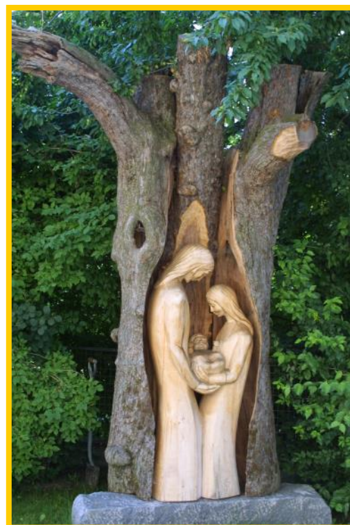
Die Station "Weihnachten" am Kirchenjahrweg rund um den Innviertler Dom