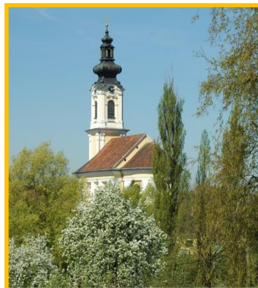
Der 65 Meter Turm fügt sich in die Landschaft ein.