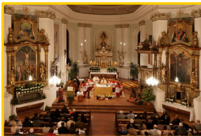
Viele Gestaltungsmöglichkeiten im großzügigen Altarraum

Die hervorragend mit dem Kirchenraum harmonisierende Orgel wird gerne zu Kirchenkonzerten genutzt. Dank der Größe und durch spezielle Beleuchtungstechniken sowie den warmfarbigen Fresken von Fritz Fröhlich bietet der Innviertler Dom ein besonderes Raumerlebnis.