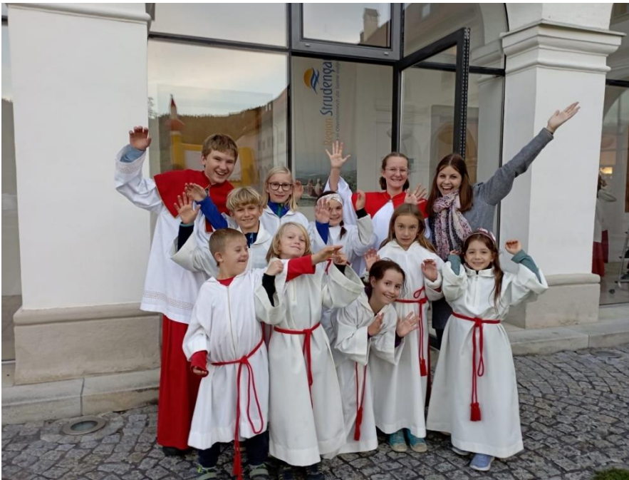
Text u. Fotos: Helena Radlmüller

Im Rahmen der Bischofsvisitation durften am 12. Oktober die Ministranten des Dekanates Grein an einem gemeinsamen Ministrantennachmittag im Stift Waldhausen teilnehmen.