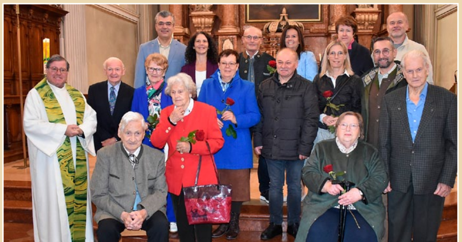
Am Sonntag, 20. Oktober feierten acht Ehepaare ihr Ehejubiläum mit Pfarrr Bachleitner in der Pfarrkirche Schärding.

Kostenfreie Nikolaus-Buchungen für 5. und 6. Dezember sind im Pfarrgemeindebüro möglich. Telefon 07712/2447, Dienstag, Donnerstag und Freitag von 8 bis 11.30 Uhr . E-Mail: schaerding.stadtschaerding@dioezese-linz.at