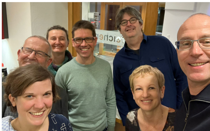
Im Bild von links nach rechts:

Weitere Kinotermine: Dienstag, 9. 5, Mittwoch, 17. 5. und Dienstag, 23. 5. 2023