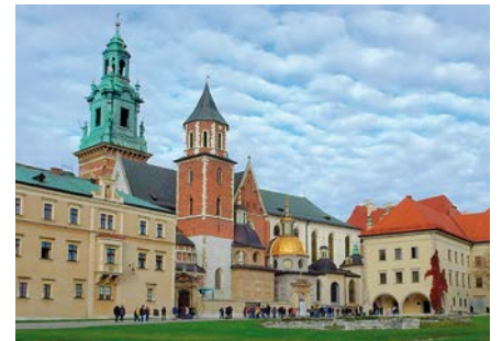
Wawel-Kathedrale in Krakau

Vorab geht es darum sich den Termin der Reise im Kalender anzuzeichnen: 27. April bis 1. Mai 2024. Wir laden schon heute zu dieser interessanten Reise herzlich ein..