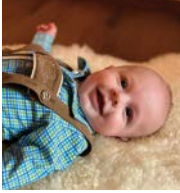
Maximilian Pieringer Spraid 1, getauft am 14. 10.