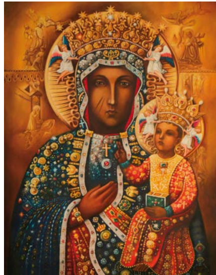
Stempel der Schwarzen Madonna von Tschenstochau (21. Jahrhundert)

Geplant sind Besichtigungen von Sehenswürdigkeiten in und um Breslau, wahrscheinlich auch Tschenstochau, dem meistbesuchten Pilgerort Polens. Millionen von Gläubigen verehren hier jedes Jahr das berühmte Gnadenbild der Schwarzen