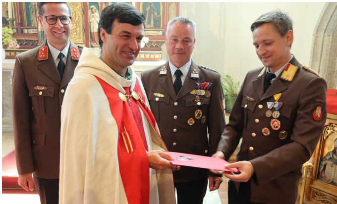
Feuerwehren die Thomas die Florian - Ehrenmedaille in Bronze überreicht haben: Homepage Feuerwehren.