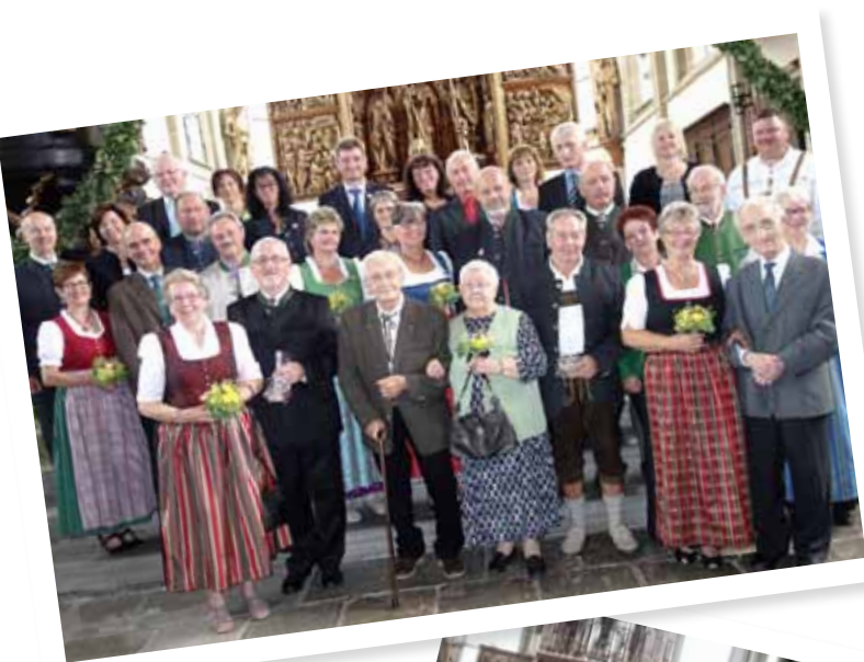
Ehejubilare und Priesterjubiläum in Kefermarkt; Fotos: Manfred Danner

Die Jubelpaare können gerne eine Foto-CD von diesem Fest haben. Bei Interesse bitte im Pfarrbü- ro melden: 07947/6203.