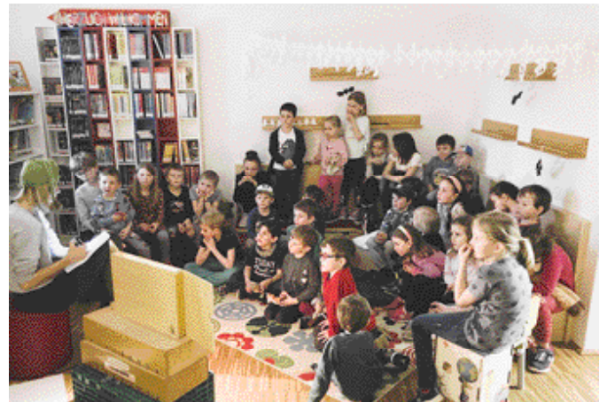
Fasziniert lauschten die kleinen Besucherinnen den spannenden Geschichten, die am Kamishibai gezeigt wurden.

Es tut sich aber noch mehr bei uns: Kürzlich haben wir den Kinderbereich in der Bücherei umgestaltet. Die Vorlesebücher sind nun neben der gemütlichen Sitzecke, während die anderen Kinderbücher übersichtlich nebeneinander platziert wurden. Auch der Eingangsbereich ist offener und lädt zum Verweilen und Schmökern ein.