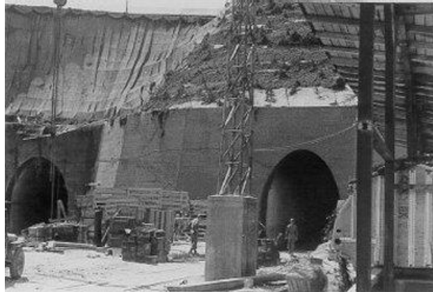
2. Abbildung: "Bergkristall" - St. Georgen/Gusen

Georgen/Gusen wurden unterirdische Stollen errichtet, um dort Waffen und Rüstungsteile für Steyr zu produzieren. Dieses Projekt ist unter dem Decknamen „Bergkristall“ bekannt. 33