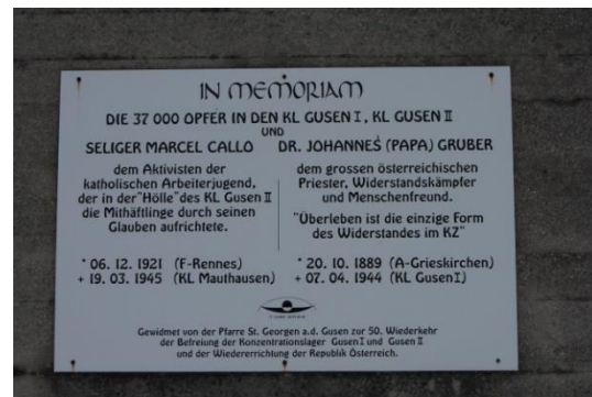
7. Abbildung: Gedenktafel - In memoriam