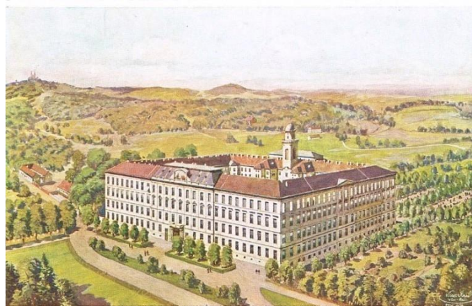
1. Abbildung: Petrinum um 1900