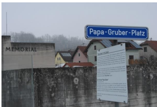
6. Abbildung: „Papa - Gruber – Platz“