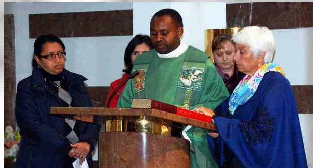
Sonntag der Völker

Gemeinsam feierten Frauen und Männer, Kinder und Jugendliche aus unterschiedlichen Kulturen das Erntedankfest und den Sonntag der Völker. Wieder einmal wurde spürbar, wie bereichernd es sein kann, wenn sich alle ohne Vorbehalt die Hand zum Friedensgruß reichen und gemeinsam dem einen Gott für das kostbare Geschenk des Lebens danken.