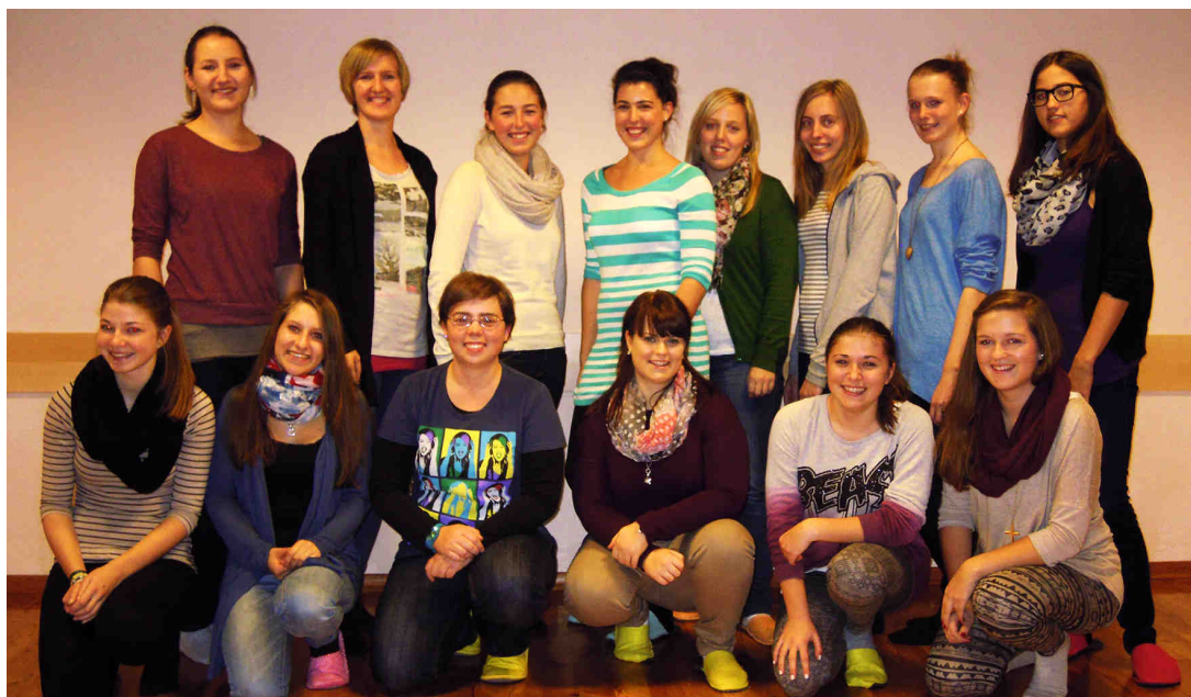
Ein Teil des Treffpunkt-Teams

Nach einem Jahr der Gruppenfindung ist der Treffpunkt nun soweit, sich zu „öffnen“ und sich auch in der Pfarre zu engagieren. Das erste große Projekt wird der Weihnachts-Pfarrkaffe am 22. 12. zugunsten der Pfarrheimsanie-