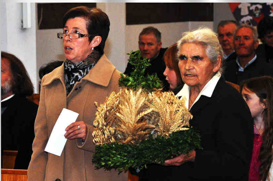
Erntedankfest mit Erntekrone

Wann? Montags bis freitags im Advent um 6.30 Uhr.