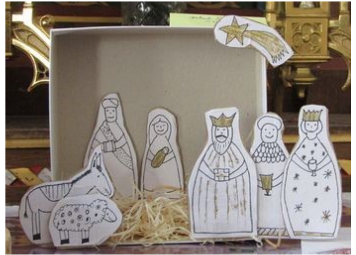
Krippe wurde von Kind aus Allerheiligen 2021 gebastelt