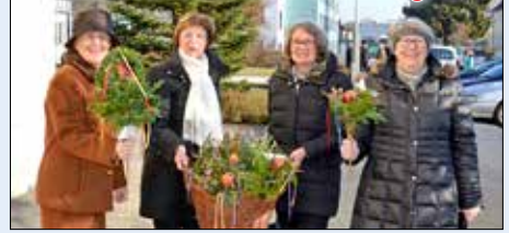
Die FRAUEN der KFB Riedberg ...

... bieten wieder Palmbüscherl an – Ihre freiwilligen Spenden sind für den Blumenschmuck!