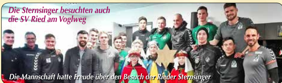
Die Sternsinger besuchten auch die SV Ried am Voglweg