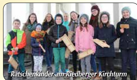
Ratschenkinder am Riedberger Kirchturm