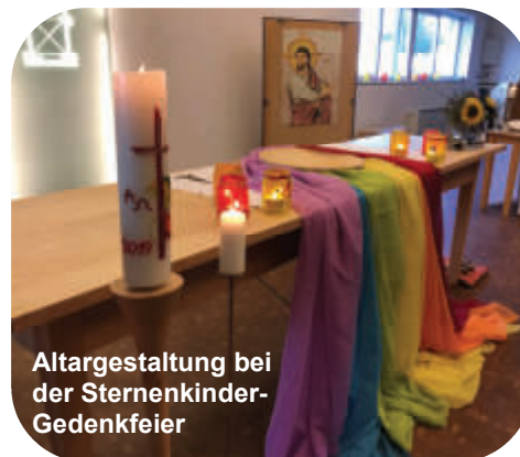
Altargestaltung bei der Sternenkinder-Gedenkfeier