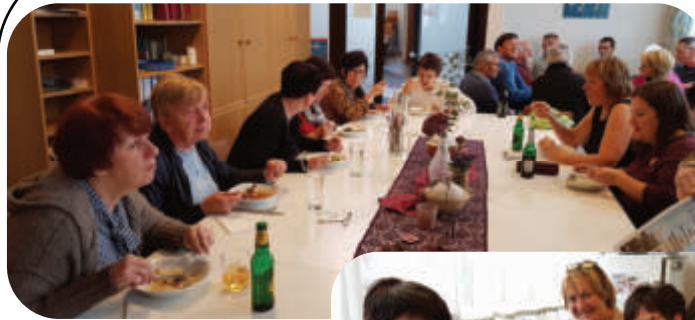
Elisabeth-Sonntag – Knödelessen am 17.11.2019

Wieder ein großer Erfolg: Mehr als 140 Knödel (in Suppe oder mit Sauerkraut) wurden nach der Sonntagsmesse an die hungrigen Gottesdienstbesucher/innen serviert.