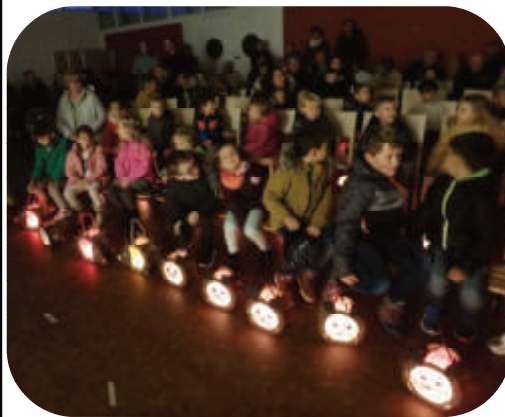
Martinsfest der Kindergärten Braunau-Neustadt und Braunau-Süd