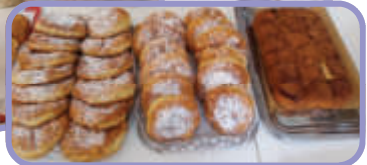
Die meisten Gottesdienstbesucher blieben zum Weißwurstessen. Anschließend wurde von unserem Damenteam Kaffee mit köstlichen Kiachln à la Maria und Wuchtl'n à la Johanna angeboten. Ein herzliches Danke dafür!