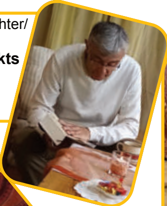
Danke den Ausrichter/innen unseres Bücherflohmarkts am 19. Oktober sowie den vielen Besucher/innen