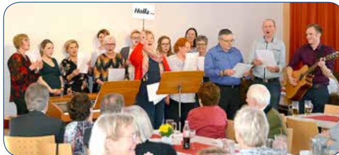
Die „Generations“ gratulieren schwungvoll und lustig