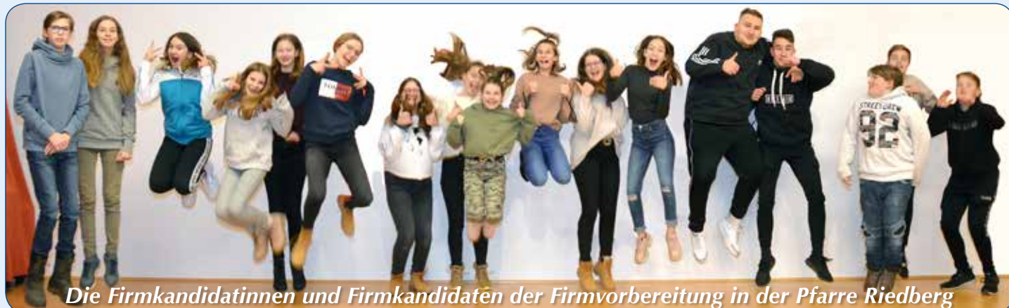
Die Firmkandidatinnen und Firmkandidaten der Firmvorbereitung in der Pfarre Riedberg