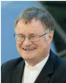
Bischof Manfred Scheuer

Zum Besuch des Bischofs und seiner engsten Mitarbeiter findet ein vielfältiges Begegnungsprogramm in Wels statt - Sie finden es auch in der Beilage.