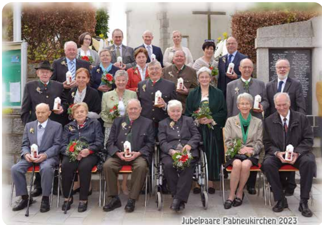
Jubelpaare Pabneukirchen 2023