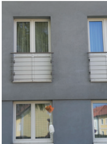
Das Ei fliegt