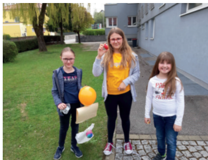
Welch ein Wunder! Es haben sogar mehrere Eier überlebt!