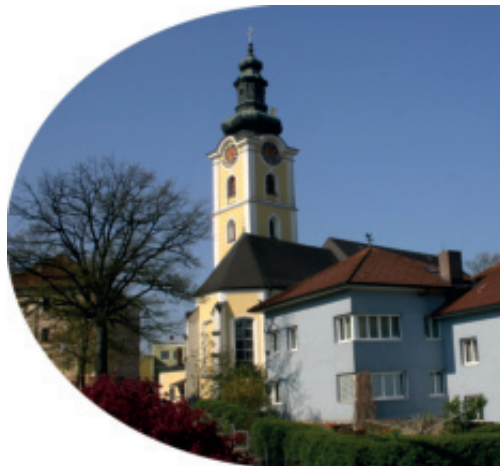
Pfarre Peter und Paul