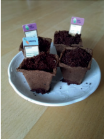
Hoffentlich wachsen alle Pflanzen gut