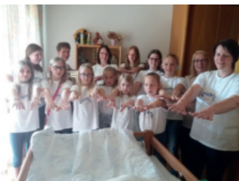
Wir brachten Muttertagsgrüße ins Altenheim.

Auch die Waizenkirchner Pensionisten haben uns eingeladen, ihre Mutter- und Vatertagsfeier mit-zugestalten. Es war uns eine Freude!