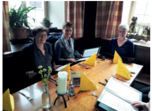
...und üben das Gelernte in der Praxis.

Der nächste Englisch-Highlight wurde für 27. Mai festgesetzt - der "KBW TALK & WALK". Ersatztermin bei Schlechtwetter ist der 3. Juni 2019. Der TALK & WALK ist ein einstündiger Morgenspaziergang mit englischer Konversation. Alle Englischbegeisterte, egal welche Lernstufe, sind eingeladen, daran teilzunehmen und mitzuplaudern. Ziel ist es, sich etwas Zeit zu nehmen um in Englisch zu plaudern, zu spazieren und die grauen Gehirnzellen zu aktivieren.