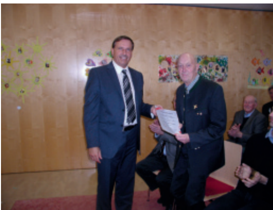
Dank an Julius Bremberger