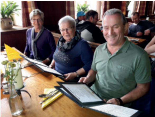
Wir feiern den erfolgreichen Abschluss....

Motiviert und mit Geduld haben die TeilnehmerInnen den Englischkurs im Frühlingssemester erfolgreich abgeschlossen. Nun wird es Zeit das Erlernte im Urlaub und auf Reisen anzuwenden.