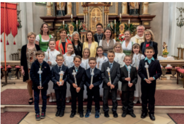
Es war ein wunderschönes Fest.