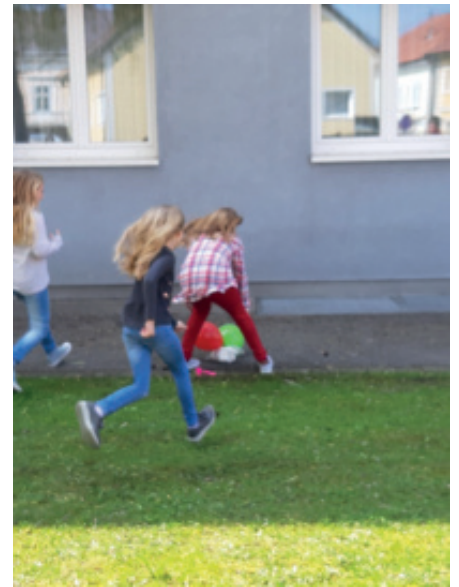
Das Ei ist gelandet