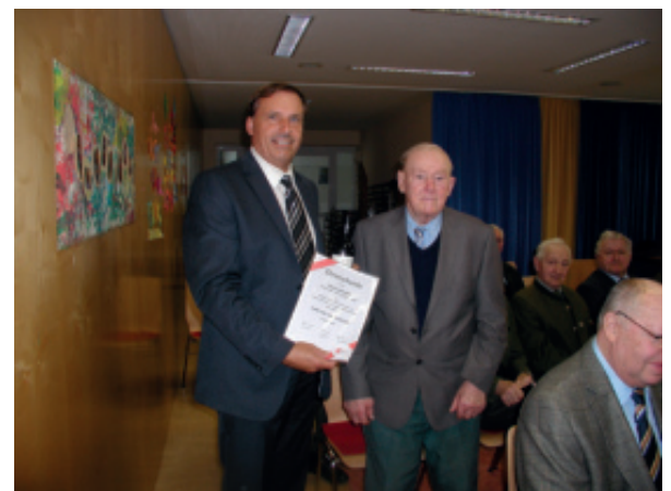
Dank an Franz Riederer