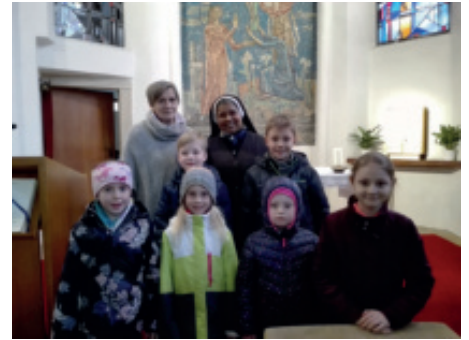
Besuch in der Hostienbäckerei