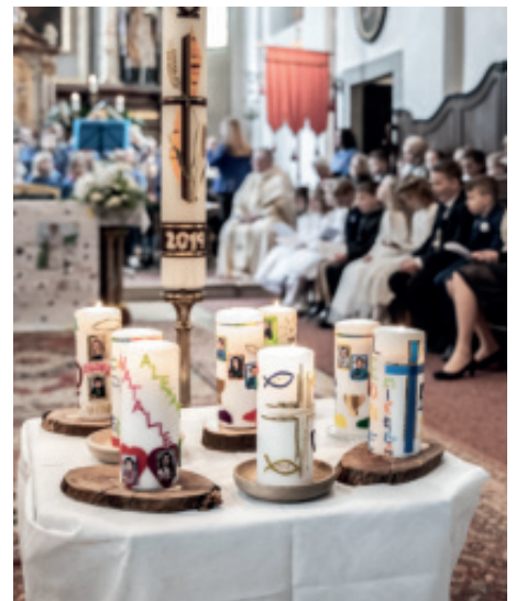
Die Gruppenkerzen als Zeichen unserer Gemeinschaft