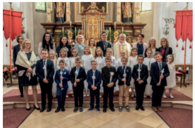
Wir lassen uns vom guten Hirten führen.