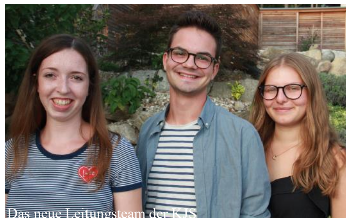
Das neue Leitungsteam der KJS