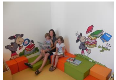
Der neu gestaltete Kinderbereich