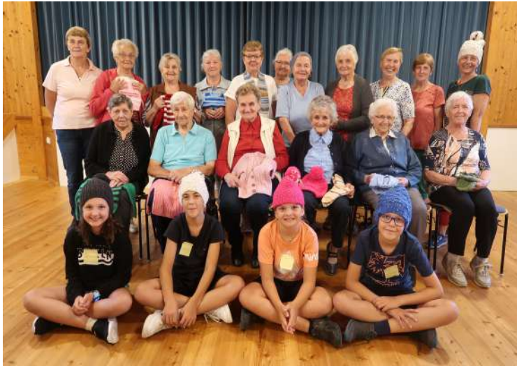
Unsere Strickerinnen, die Caritas-Mitarbeiterinnen und die Minis, die den Nachmittag mitgestalteten

Am Ende des Sommers wurden – so wie jedes Jahr - die Strickerinnen der Pfarrcaritas zu einem gemeinsamen Nachmittag im Pfarrheim eingeladen.