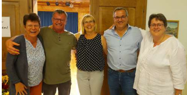
Die Leitung des Pfarrgemeinderates freute sich über ein gelungenes Fest.