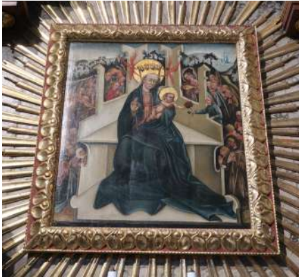
Gnadenbild „Maria Sechsfinger“ in Maria Laach

Im Mai verbrachten 50 Frauen einen schönen Tag bei der Frauenwallfahrt.