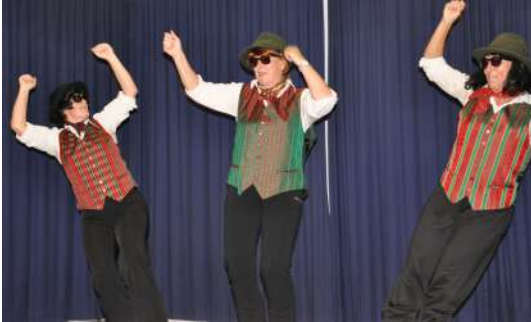
Lustige Einlagen begeisterten alle Gäste.