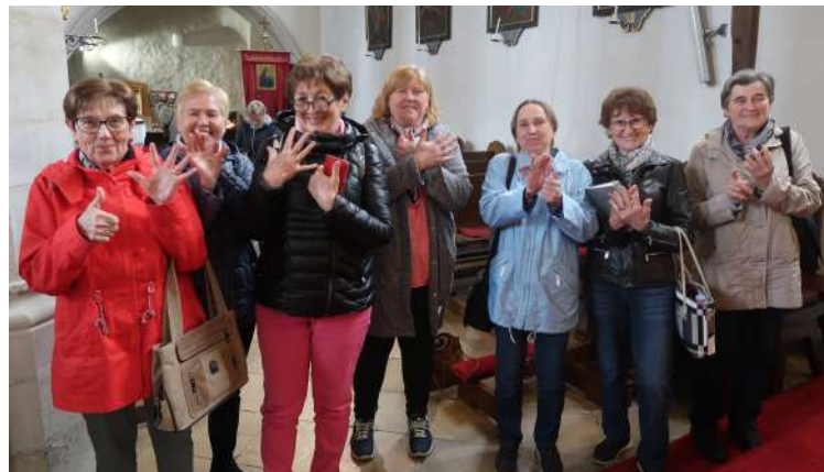
Das mit den sechs Fingern probieren auch manche von uns aus

Danke an alle, die dazu einen Beitrag geleistet haben.