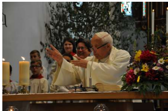
Unser Pfarrmoderator „in Action“ – beim Dirigieren seines Lieblingskanons „Lobet und preiset ihr Völker den Herrn“