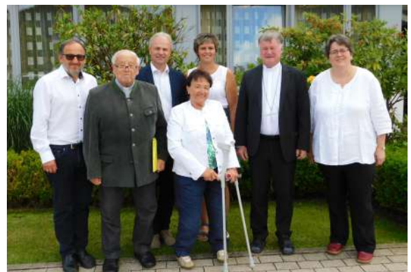
Auch dem Seniorenheim wurde ein Besuch abgestattet.