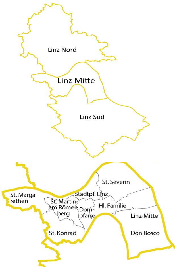
Abb. oben: Dekanate in Linz unten: Pfarren des Dekanates Linz-Mitte