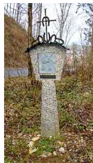
Eine der Kreuzwegstationen auf unserem Weg

In St. Leonhard wird als Abschluss um 19.00 Uhr ein Gottesdienst gefeiert.