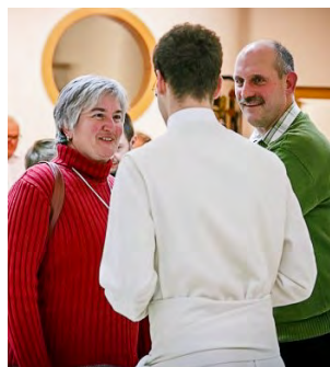
Auch aus unserer Pfarre waren ca. 15 Personen dabei