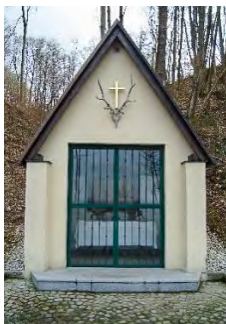
Hubertuskapelle in Pucking

Treffpunkt: am Ortsplatz Pucking bei der Kirche – von dort gehen wir gemeinsam zur Hubertuskapelle, wo um 18.15 Uhr die Wanderung beginnt.