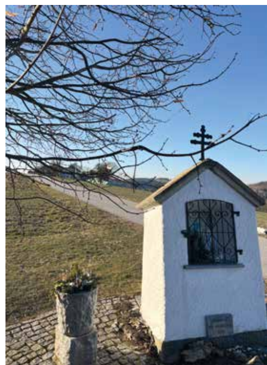
„Schiefe Kapelle“ in Lacken

Schiefe Kapelle: Maiandacht, musikalische Gestaltung: Abordnung der Musikkapelle Lacken