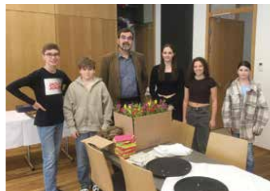
Mithilfe beim Pfarrkaffee

Die Firmung findet am Sonntag, dem 26. Mai 2024 um 10 Uhr in der Pfarrkirche in St. Martin statt.