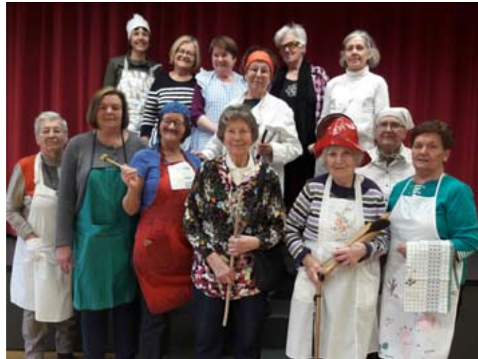
Kfb - Faschingsrunde

wir durften so erfahren, dass Singen befreit und Balsam für Leib und Seele ist. Denn was kann uns schon erschüttern, wenn wir uns folgendes immer