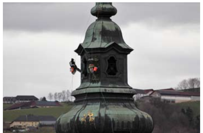
Bei diesem Job sollte man schwindelfrei sein!