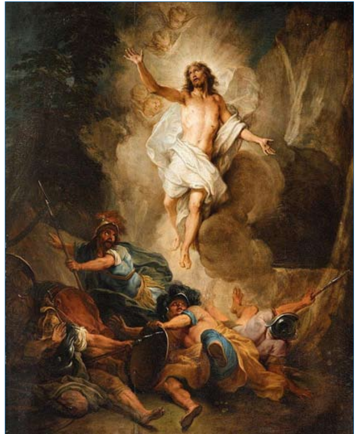
Auferstehung Christi (Nicolas Bertin, 1667-1736)

Gottesdienste: 07.00 Uhr: Konventmesse, 08.30: Pfarrmesse, 10.00 Uhr: Singmesse, 18.00 Uhr: Vesper