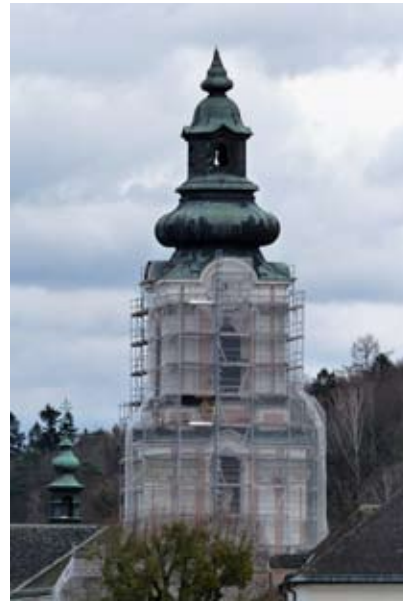
Der eingerüstete Kirchturm ohne Kreuz