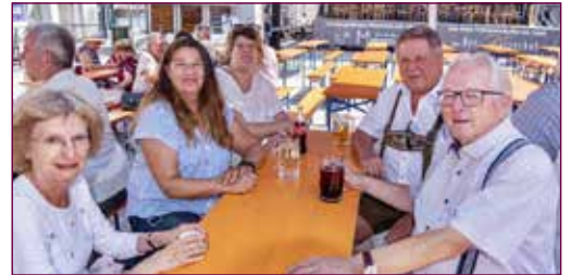
Viele Mitfeiernde aus den zwei Rieder Pfarren sowie der Kapuzinerkirche und der Konvikt-Gemeinde blieben auch zum Mittagstisch!