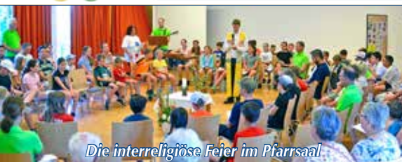
Die interreligiöse Feier im Pfarrsaal