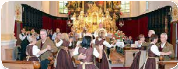
STADTPFARRE RIED . . . LESEN SIE AUF SEITE 3