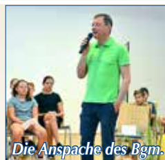
Die Ansprache des Bgm.