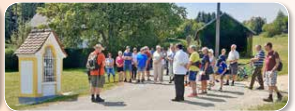
FUSSWALLFAHRT NACH EITZING > LESEN SIE AUF SEITE 6