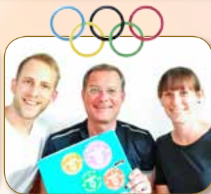
LESEN SIE AUF SEITE 13