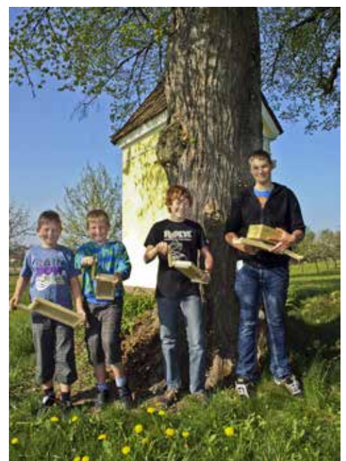
Erinnerung an lustige Erlebnisse der ehemaligen Ministranten.

Niederndorf, Keppling, Jänergasse, Thallham, Corethstraße (ohne Schloss Hochscharten), Am Mitterfeld, Inzing Nr. 16