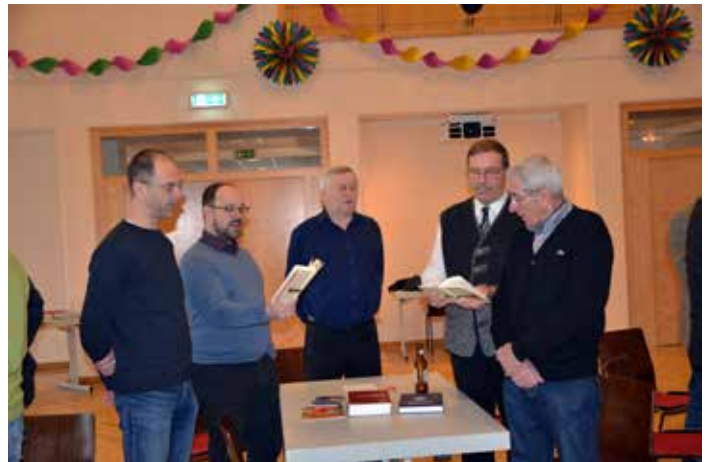
Alle waren eingeladen, sich einzubringen!