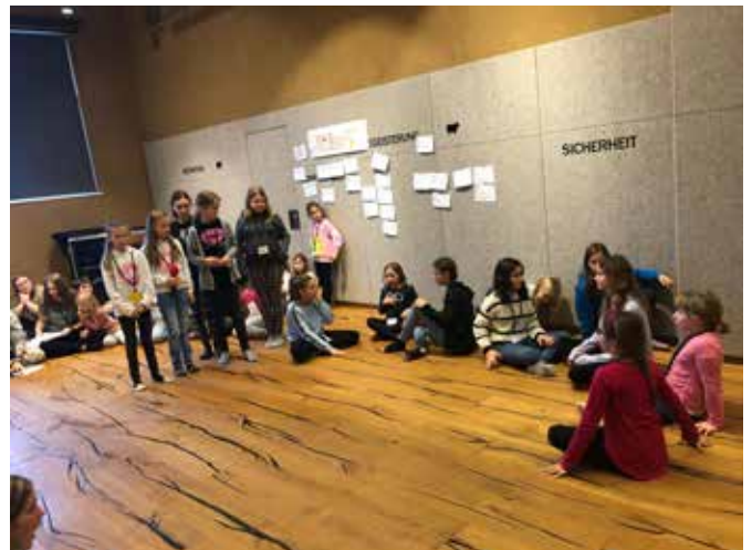
Beim Workshoptag sind alle mit Eifer dabei. Anschließend gibt es eine wohlverdiente Jause!

Wir laden euch deshalb ganz herzlich ein, eine unserer Vorstellungen zu besuchen: am Samstag, 25. März um 14:30 Uhr und um 19:00 Uhr, am Sonntag, 26. März um 14:30 Uhr, jeweils im Pfarrheim