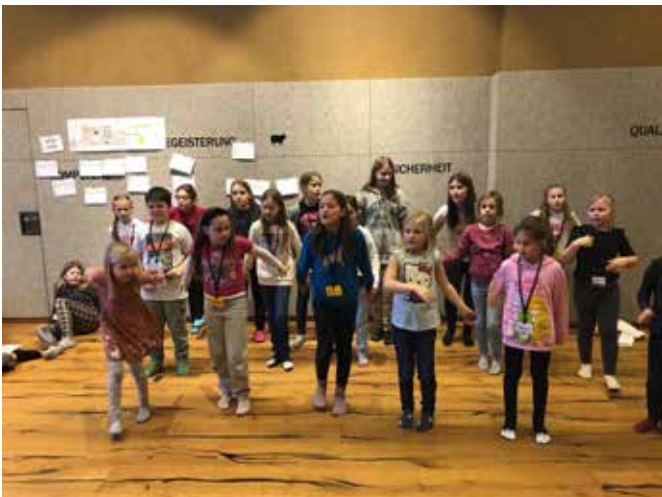
Die ersten Tänze werden geprobt.

Bei einem gemeinsamen Workshop- Samstag wurde getanzt, gesungen, geprobt und gaaanz viel gelacht!! Natürlich gehört zu so einem Projekt wieder der volle Einsatz jedes Kindes und der Erwachsenen dazu. Und die Bereitschaft, das eine oder andere Mal eine zusätzliche Probe in den Alltag zu integrieren.