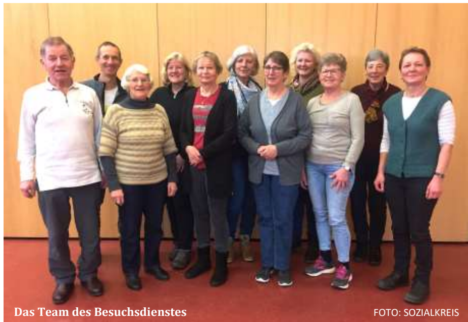
Das Team des Besuchsdienstes