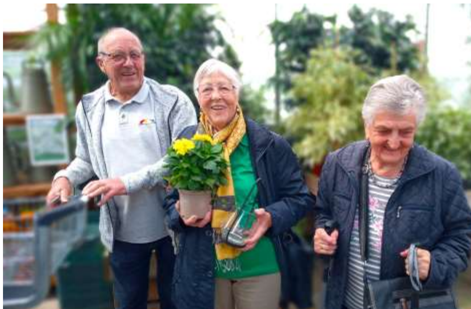
Bild links und Bilderreihe rechts: Ausflug nach St. Florian in eine Gärtnerei und danach zur Stärkung nach Kronsdorf.

Blumen und Pflanzen für die Seele und ein erfrischendes Getränk sind immer etwas Feines.