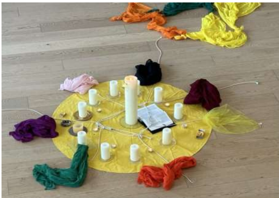
Die Osterkerze eint symbolisch die (Kerzen der) zwölf Pfarrteilgemeinden.

Die Pfarre Mühlviertel-Mitte – ein Raum zur Begegnung