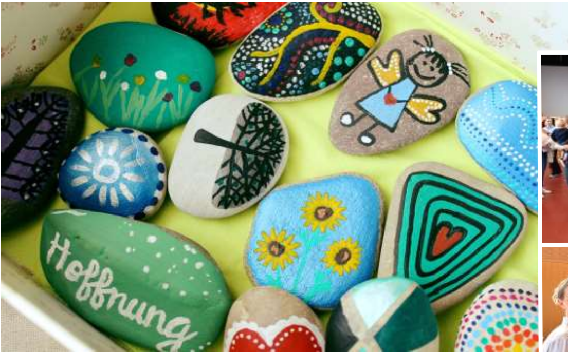
Gebetspatensteine in der Lichterkapelle schenken Hoffnung.

Besuchsdienstprojekt. Dieses Projekt ist gut angelaufen (nähere Infos siehe Spalte Seite 16 links, am Foto daneben: das Besuchsdienst-Team).