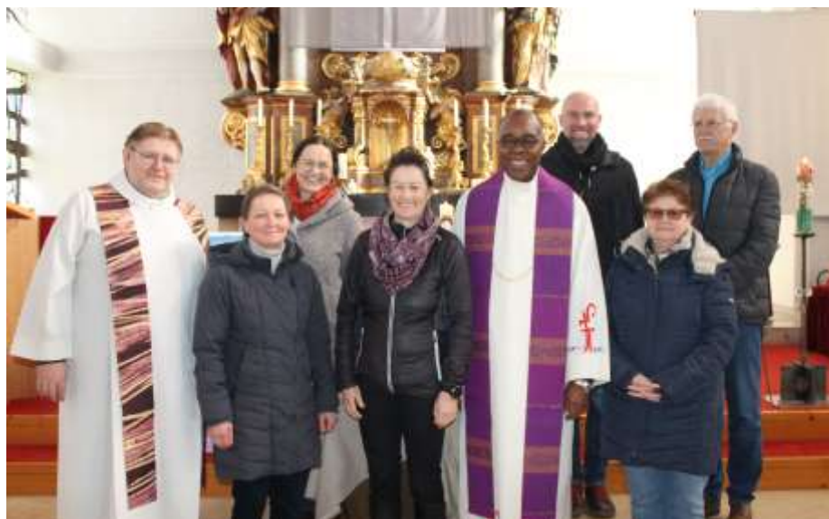
Beauftragung des Seelsorgeteams am 25. Februar 2024