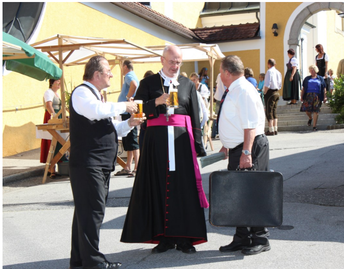
15.08.2012 Segnung der Kirche nach Außenrenovierung