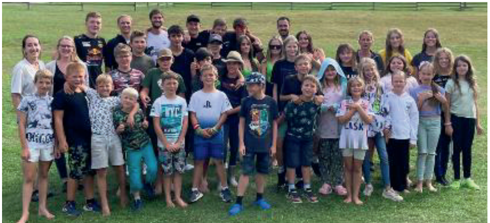
Beim Jungscharlager verbrachten alle eine aufregende und lustige Woche.