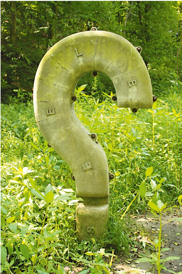
Jaume Plensa, Seele, Skulpturenpfad „Menschenspuren“, Neandertal, Foto: H. Brunner

MITTEILUNGSBLATT der Pfarre Weißkirchen im Jahr 2021