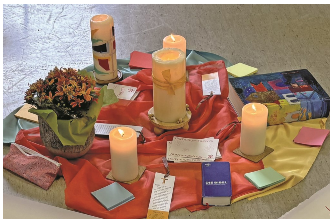
Die Heilige Schrift und das Licht Jesu sind uns Wegweiser durch den Advent.