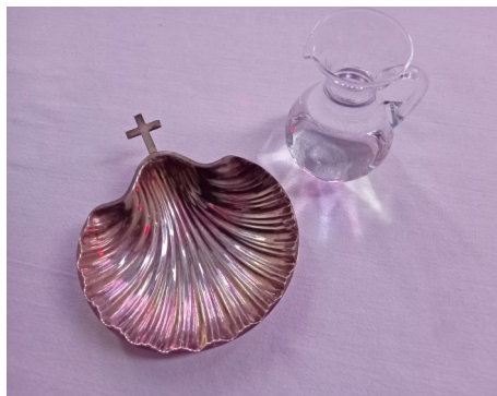
Taufschale mit Weihwasser