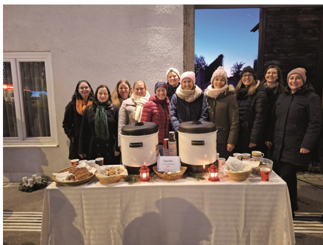
Das Team der Kinderliturgie schenkte nach der Segnung der Adventkränze am 30. November 2024 vor der Stadtpfarrkirche einen wärmenden Punsch aus.