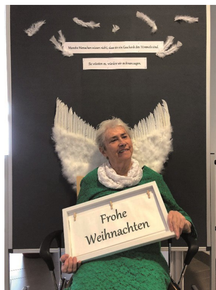
Im SENIORium Perg gibt es viele Engel.

Birgit Schopf, Seelsorgerin im SENIORium Perg